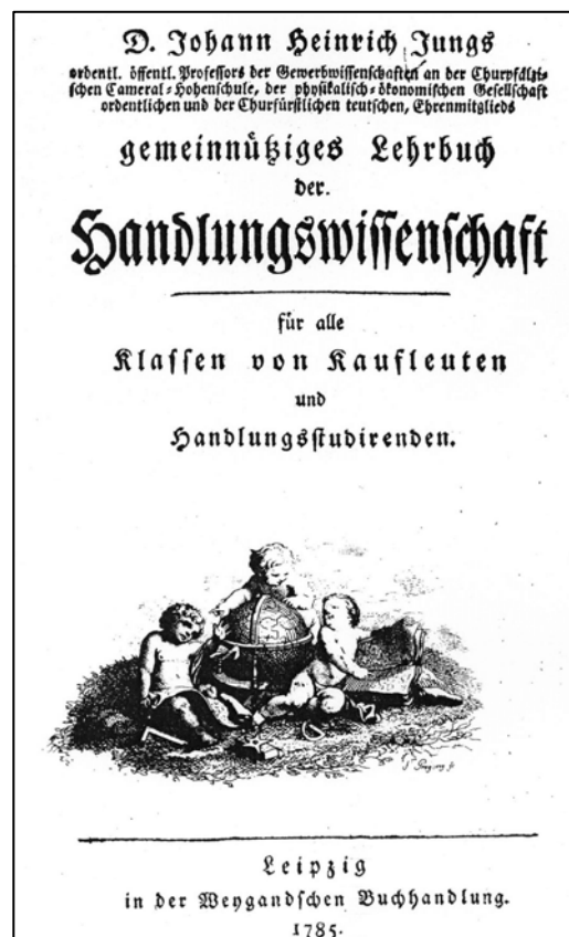
Abb. 2: Titelblatt der Erstausgabe der "Handlungswissenschaft" von 1785 90

In den vorangegangenen Kapiteln wurden ausführlich Ausgangssituation und Hintergründe für den historischen Vergleich mit dem Lehrsystem Jung-Stillings erläutert. So wurden aus dem wirtschaftspädagogischen Wissenschaftsverständnis heraus Begriffe abgegrenzt, die als Vergleichskriterien herangezogen werden. Zusammen mit dem Selbstverständnis Stillings können nun diese Begriffsbestimmungen in ähnlicher Weise aus dem „Gemeinnützigen Lehrbuch der Handlungswissenschaft“ herausgefiltert werden. Das verwendete Lehrbuch gehört laut Norbert Holubar „der sogenannten »Zeit der systematischen Handlungswissenschaft« (1675-1804) an, welche die kameral(-merkantil-)wissenschaftliche und die handlungswissenschaftliche Literatur umfaßt.“ 91 Er ordnet das Werk mehr der kame-